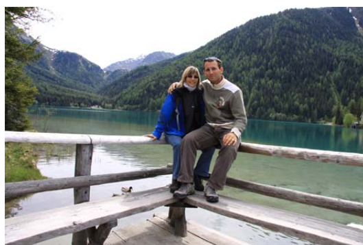
Lago di Anterselva