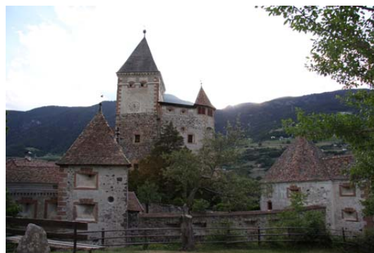
Castello di Trostburg a Ponte Gardena