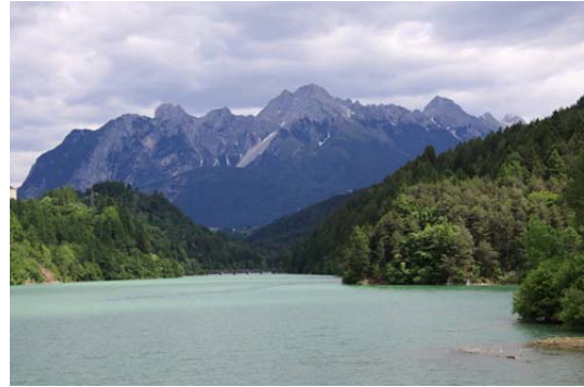
Lago di Pieve di Cadore