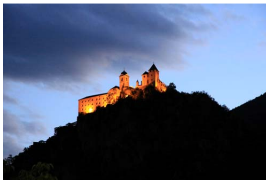
Kloster Säben da Chiusa