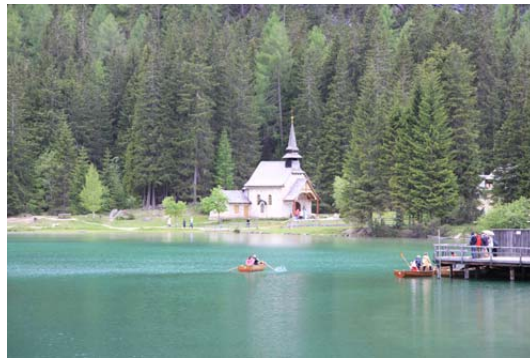
Lago di Braies