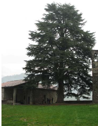
Barga: il duomo