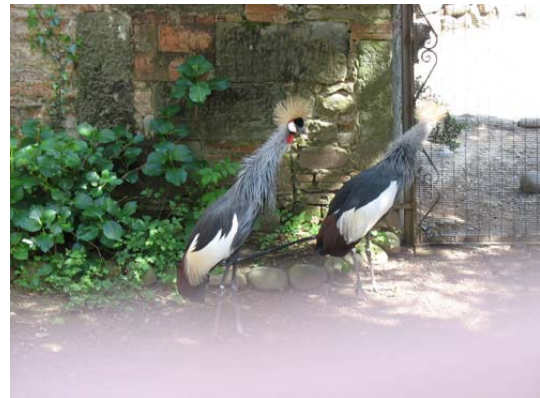
Collodi: Villa Garzoni e giardino; uccelli del paradiso.

Ci spostiamo poi a Bagni di Lucca, percorrendo la strettissima stradina che passa per Boveglio , borgo molto carino.