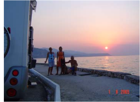
Tramonto a Lygia