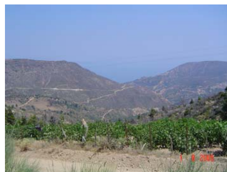
Panorama dalla strada Diakofto - Kalavrita

Per questa prima giornata in Grecia decidiamo di andare in