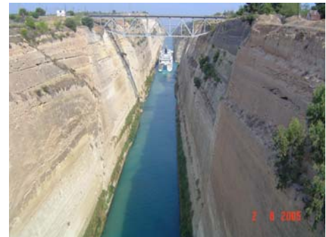
Canale di Corinto