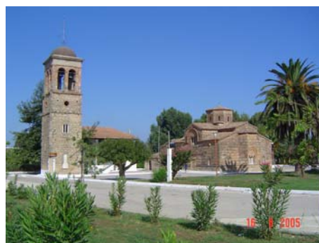
Gastuoni - Chiesa bizantina

Ci fermiamo sulla bella spiaggia di Kalamia: dune, sabbia finissima e acqua limpidissima.