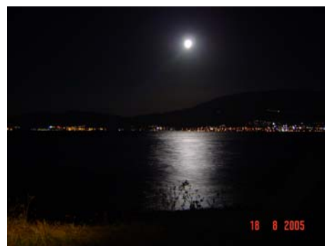
Kapo Platanis e Ponte Rio-Antirio

Quando cala la notte il ponte, di cui abbiamo una vista completa, viene illuminato di giallo e blu: davvero bello.