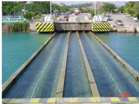
Ponte che si immerge nel canale di Corinto

L'unico nostro obiettivo su Corinto sono le foto al canale; per farle da un'ottima angolazione prima raggiungiamo Isthimia (dall'altra parte dello stretto), paese in cui il ponte si immerge per far passare le navi, poi ammiriamo gli scavi dall'alto ritornando nel Peloponesso per la strada normale.