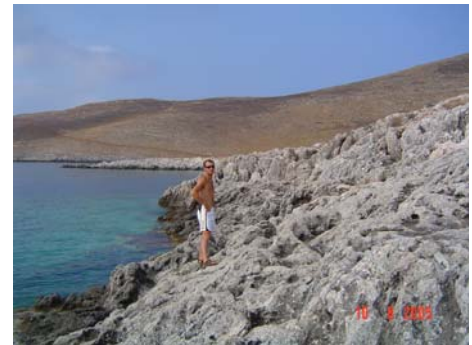
Golfo di Taenaro