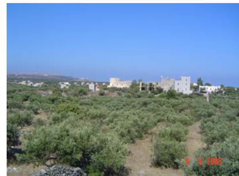
Mani - Case turrette

assaggiamo tutti: questi sono buoni; la spesa complessiva è stata di circa 10€ a testa.