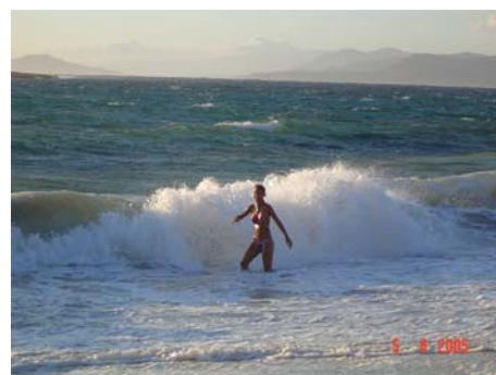
Isola di Elafonisos - Spiaggia Panagia