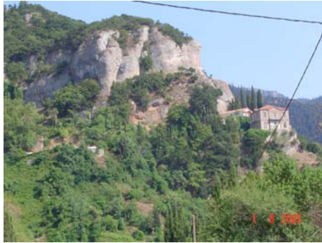
Monastero sulla strada Diakofto - Kalavrita

montagna e percorriamo la strada che da Diakofto raggiunge Kalavrita, da cui possiamo gustarci il panorama, molto brullo e solo alla fine verdeggiante. Verso sera ci riportiamo in costa e troviamo un bel piazzale asfaltato a Lygia, sul mare.