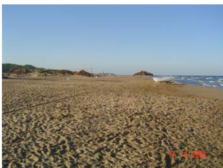
Spiaggia di Kalamia