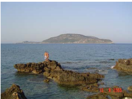
Dintorni di Marathopoli

ne vanno all'ora di pranzo: quasi fino al tramonto la costa è tutta per noi. Sul fondale si trovano bellissime formazioni di roccia, che assomigliano agli scivoli chiusi dell'acquaparco.