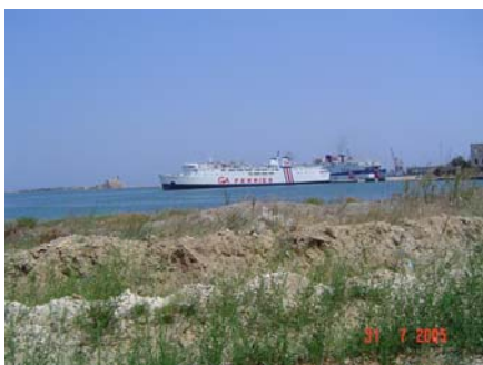
Porto di Brindisi

Dopo una nottata infernale (un via vai di automezzi nel parcheggio perenne) trascorsa in una stazione di servizio nei pressi Pescara, ripartiamo all’alba per Brindisi; vi arriviamo all’ora di pranzo, ma prima di metterci a tavola cerchiamo un posto tranquillo e ombreggiato; imbocchiamo quindi una strada sul lato sinistro del porto che ci permette di aspettare l’imbarco delle 16:30 facendo un bagno e rilassandoci.