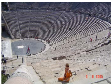
Teatro di Epidauro

Il piccolo museo racchiude al suo interno qualche "pezzo" originale e molte ricostruzioni.