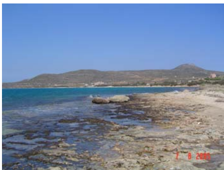
Isola di Elafonisos - Spiaggia Panagia

Siccome abbiamo voglia di rilassarci e rinfrescarci un po', tralasciamo altre mete lungo il percorso e raggiungiamo la piccola isola di Elafonissi, prendendo il traghetto a Vinglafia (20,70€ per il camper + 1€ a persona). Durante la breve navigazione di circa 15