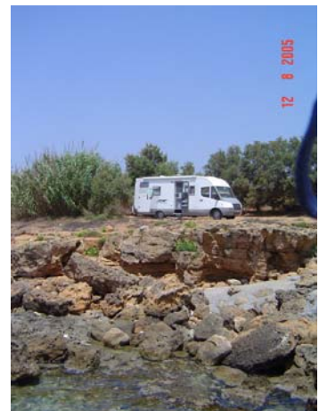
Dintorni di Marathopoli

Oltrepassiamo Methoni e Pylos, diamo un'occhiata alla baia di Voidokilia (lunga spiaggia di sabbia in una riserva naturale di ambiente paludoso, acqua bella), ma non abbiamo più voglia di sabbia, quindi proseguiamo verso nord sulla strada principale fino a Gargagliani, per riportarci poi sulla costa. Dopo Marathopoli, verso Lagouvardos, dopo un distributore di benzina voltiamo a sinistra su uno stradone di ghiaia, che ci porta ad uno spiazzo che ci offre come panorama l'ultimo pezzo dell'isola di Proti e due bellissime piscine di roccia. I locali presenti al nostro arrivo se