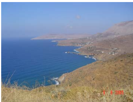
Dintorni di Porto Kagio

Oggi ci inoltriamo nel Mani, percorrendo la strada, non troppo stretta ma a strapiombo, del versante occidentale; il panorama è decisamente bello, selvaggio, brullo e punteggiato di case turrette.